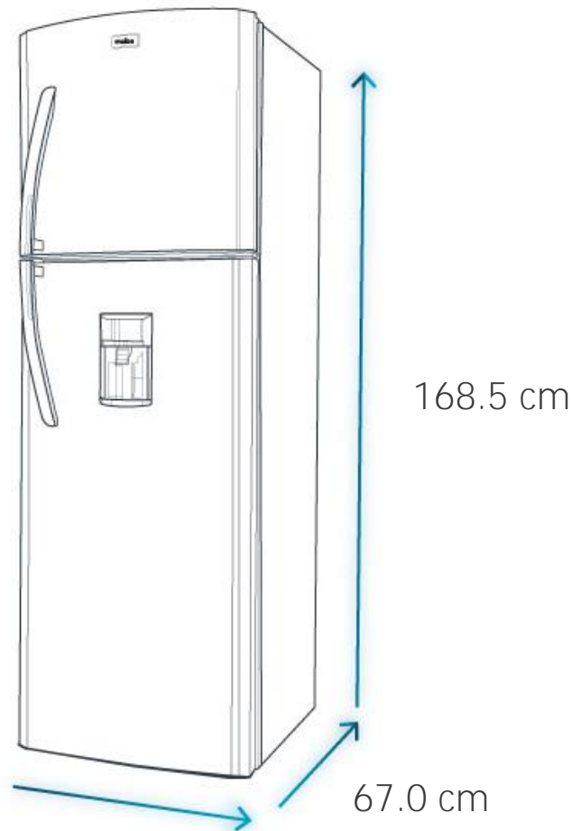
Diagrama y medidas de instalación